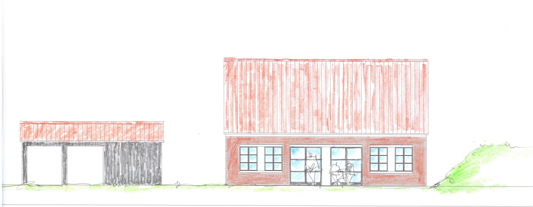
FACADE MOD SYD