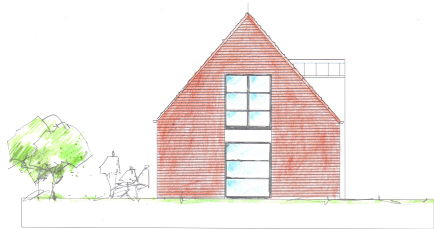
FACADE MOD ØST