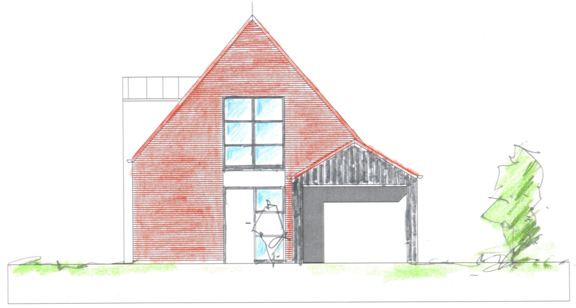
FACADE MOD VEST