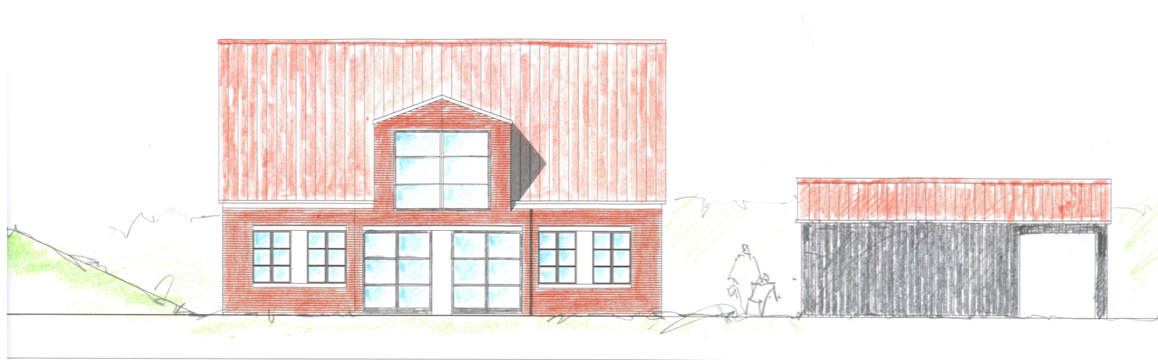
FACADE MOD NORD